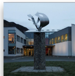
Instituto Secundaria de Verdal